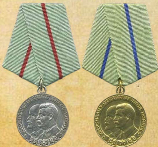
медалями «Партизану Отечественной войны» I и II степени