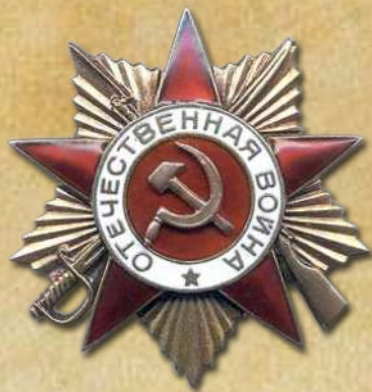
орденом «Знак Почёта»