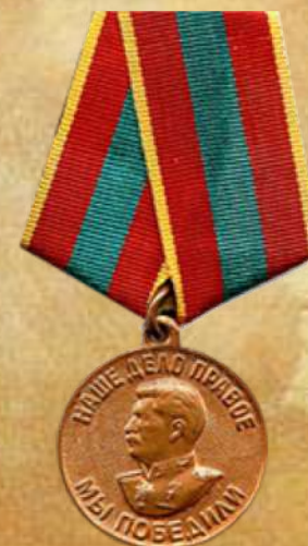
медалью «За доблестный труд»