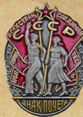
орденом «Великой Отечественной войны» II степени