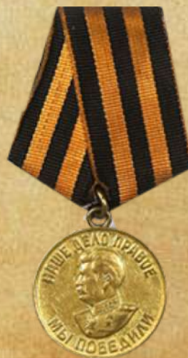
медалью «За победу над Германией в Великой Отечественной войне 1941–1945 гг.»